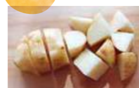
じゃがいも乱切り